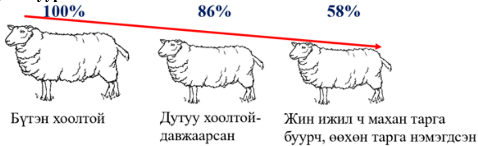
Зураг 2 Бэлчээрийн даац хэтрэлт, тэжээлийн архаг дутагдлаас малын ашиг шим, үнэ цэнэ буурч байгаа нь